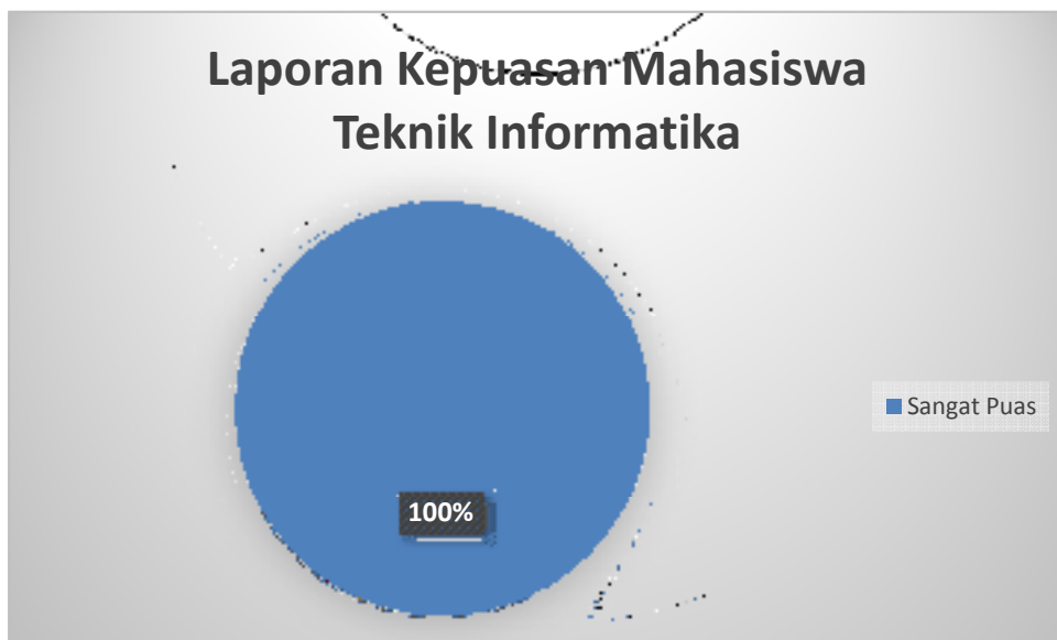
Gambar 3 Grafik Kepuasan Layanan Mahasiswa T. Informatika