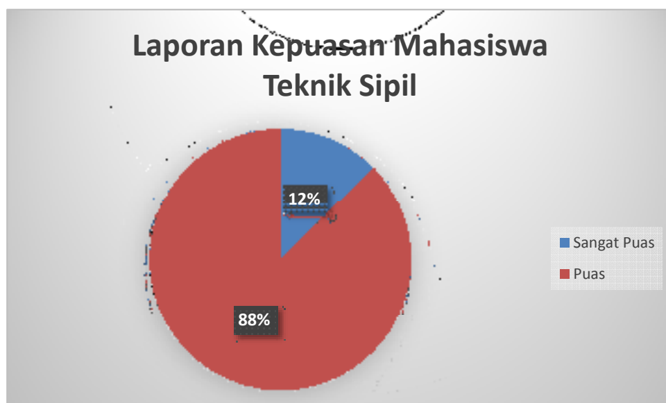
Gambar 3 Grafik Kepuasan Layanan Mahasiswa T. Sipil