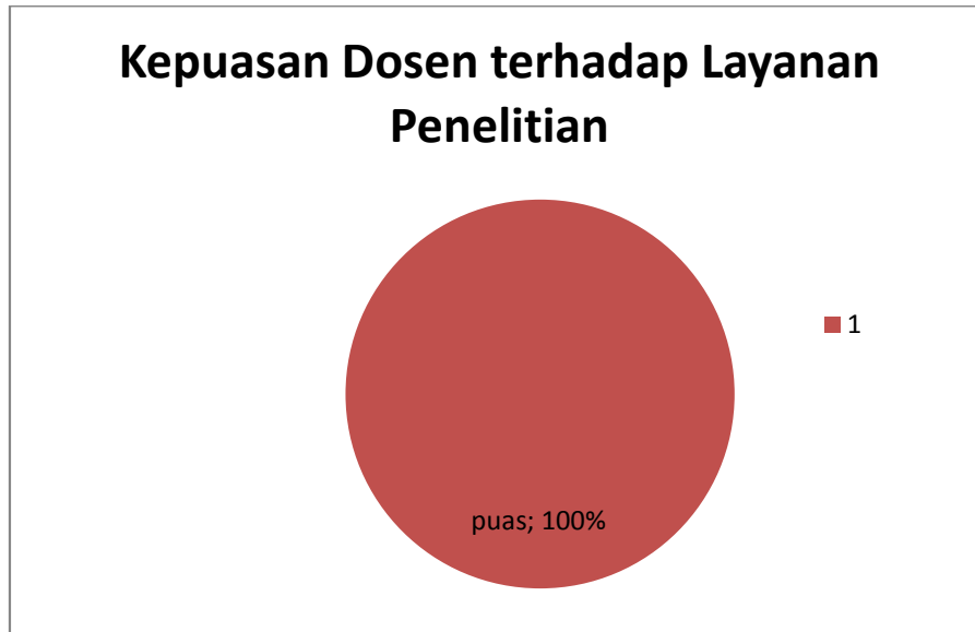
Gambar 1 Grafik Kepuasan Dosen terhadap Layanan Pengelolaan Penelitian