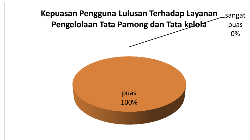
Gambar 3.3 Grafik Kepuasan Pengguna Lulusan terhadap Layanan Pengelolaan Tata Pamong dan Tata Kelola