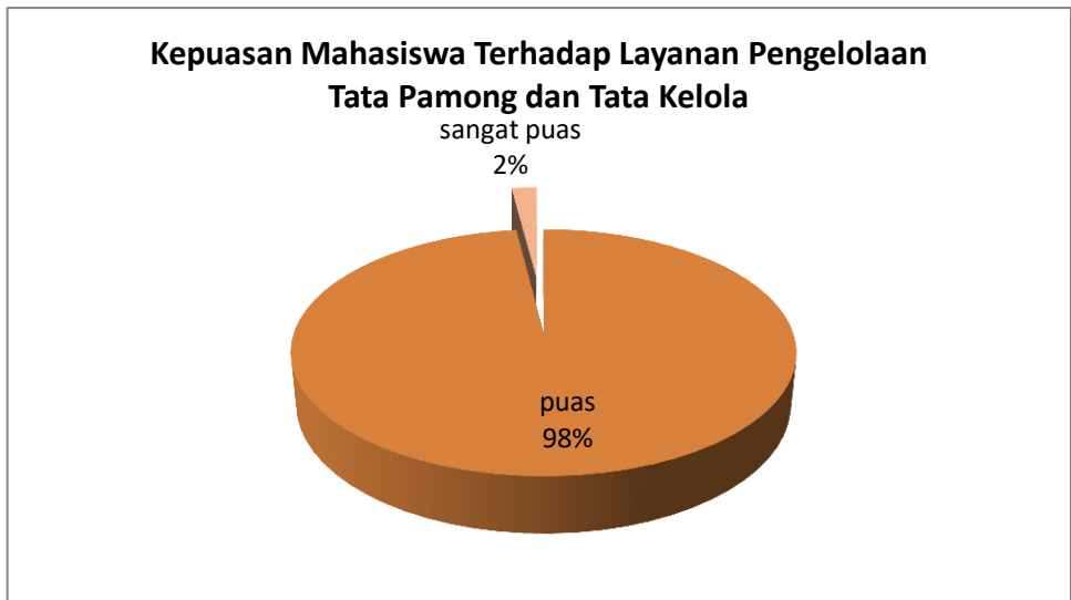
Gambar 3.2 Grafik Kepuasan Mahasiswa terhadap Layanan Pengelolaan Tata Pamong dan Tata Kelola